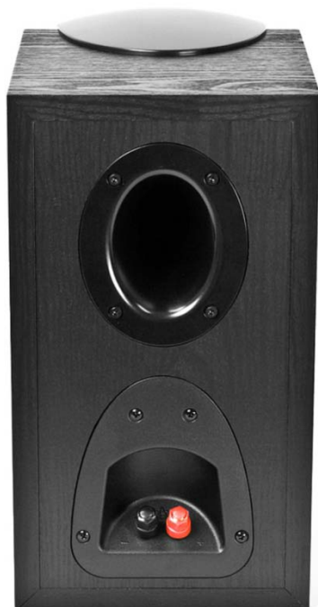
B-20 BLACK widok z tyłu