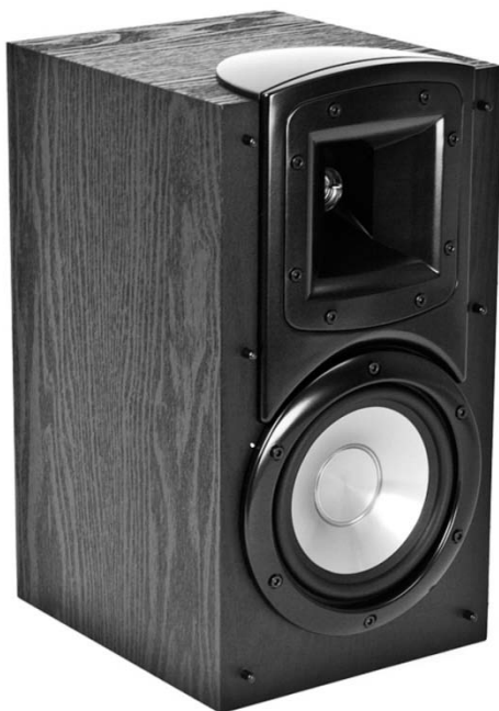
B-20 BLACK ujęcie 1