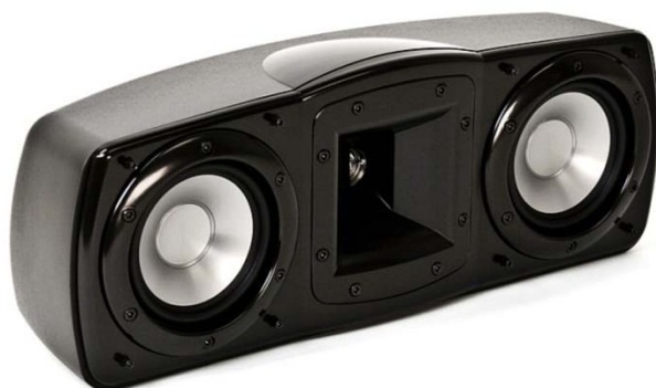
C-10 BLACK ujęcie 1