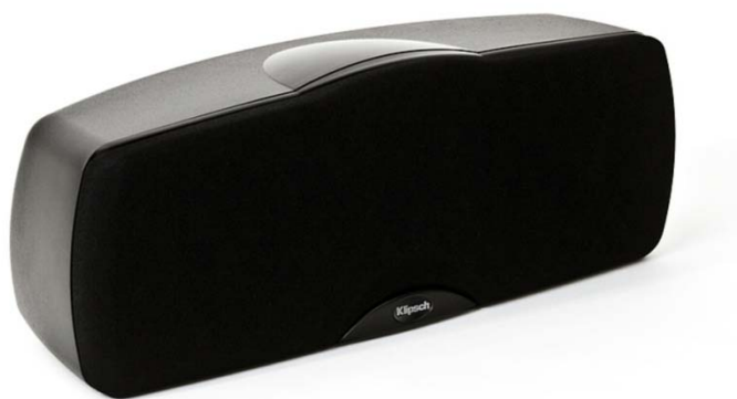
C-10 BLACK ujęcie 1 z maskownicą