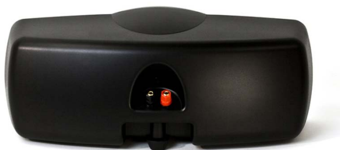
C-10 BLACK widok z tyłu