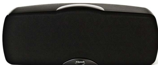
C-10 BLACK front z maskownicą