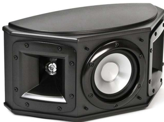
S-10 BLACK ujęcie 1