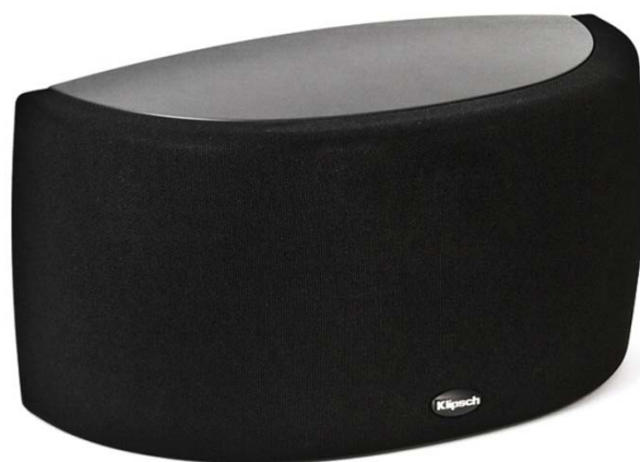
S-10 BLACK ujęcie 1 z maskownicą