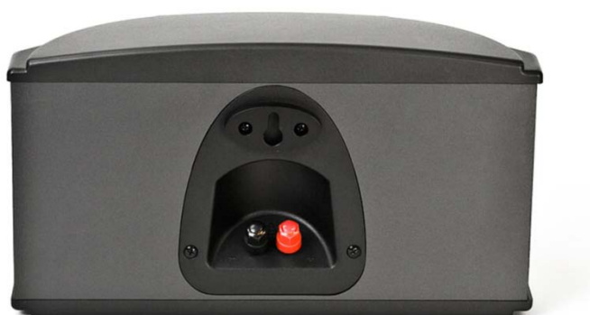
S-10 BLACK widok z tyłu