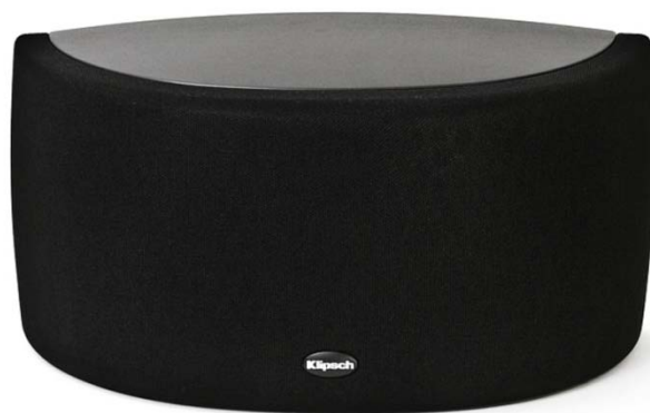
S-10 BLACK front z maskownicą